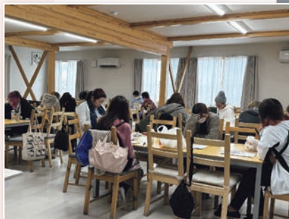
▲クリニックでのデイケア