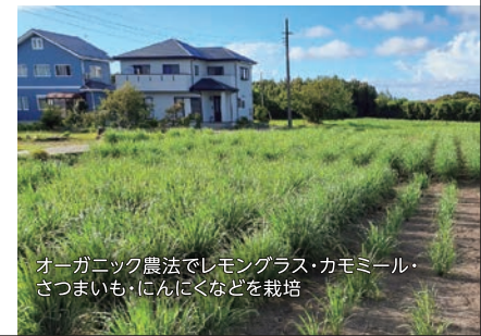
オーガニック農法でレモングラス・カモミール・さつまいも・こんにゃくなどを栽培