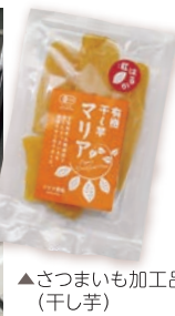
▲さつまいも加工品(干し芋)